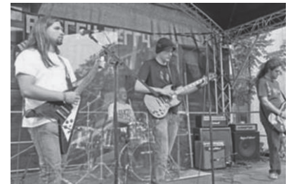
Rockten als erste Band des Wettbewerbs: „Mighty Morphin“ standen nach dem Auftakt der Berliner Profis von „Pretty Betty“ auf der Bühne auf dem Pelizaeusplatz.