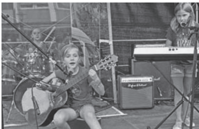
Die drei Mädchen von „The 3 Best“ belegten mit ihrem Kontrastprogramm zu den rauhen Stimmen und harten Gitarrenklängen so manch anderer Band den dritten Platz.